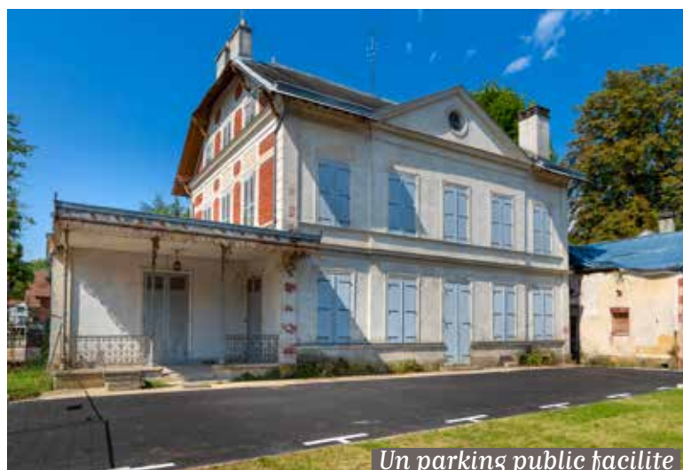
Un parking public facilite l'accès au bâtiment.

La commune propose à la vente un bâtiment situé au 1 boulevard de la République . Ce bâtiment, d'une surface totale de 350 m 2 , comprend un petit terrain adjacent. Un parking public de 5 places facilite l'accès.