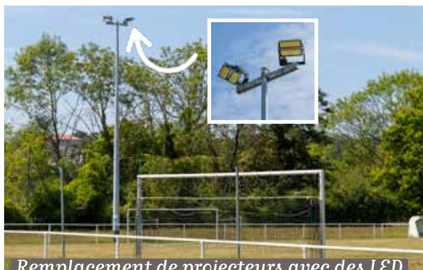
Remplacement de projecteurs avec des LED au stade des Donjons.