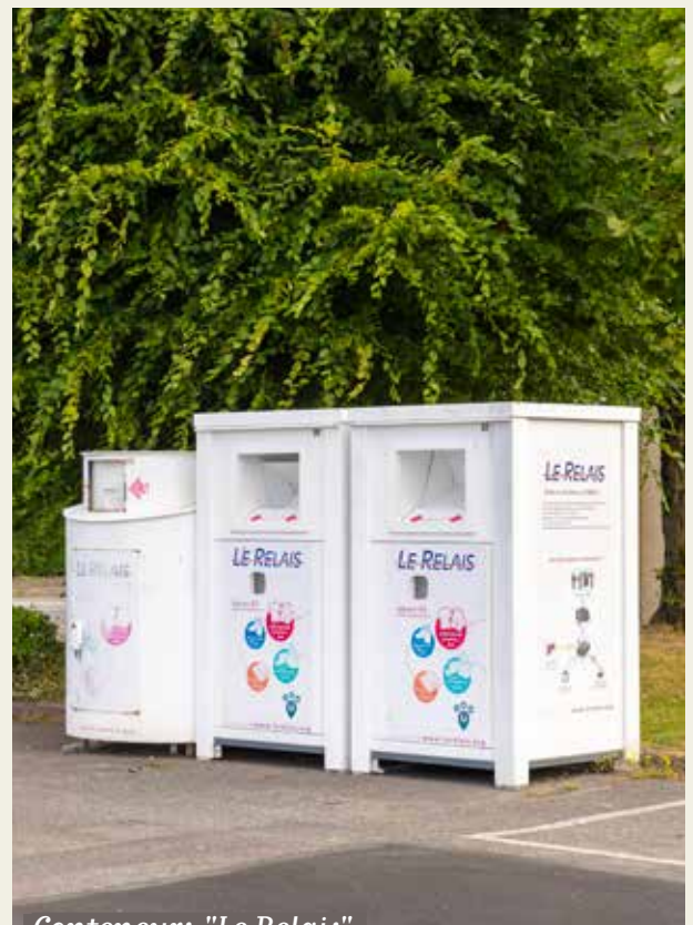
Conteneurs "Le Relais", au parking des Meillottes.

Le Relais est un opérateur important de la filière de collecte et valorisation de textile, engagé dans la lutte contre l'exclusion par la création d'emplois locaux et durables.