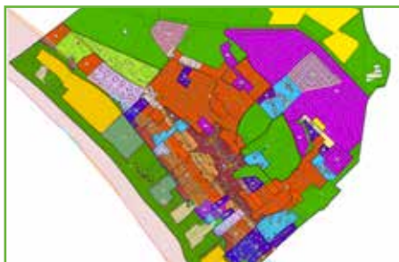
Le projet de règlement graphique

Suite à l'arrêt du PLU par le conseil municipal le 25 mars 2024, une enquête publique se tiendra du 30 septembre au 29 octobre inclus. Cette phase permettra aux Soiséens de s'informer et de s'exprimer sur le projet de PLU.