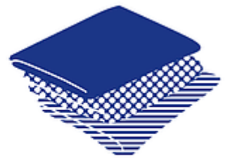
linge de maison

Pour déposer des vêtements dans les conteneurs "Le Relais", il est nécessaire de suivre quelques règles précises.