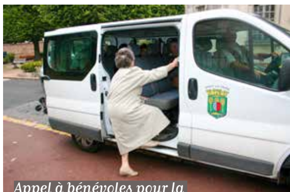
Appel à bénévoles pour la conduite des navettes seniors