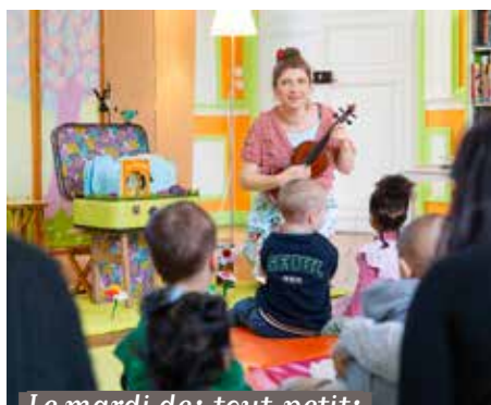
Le mardi des tout-petits