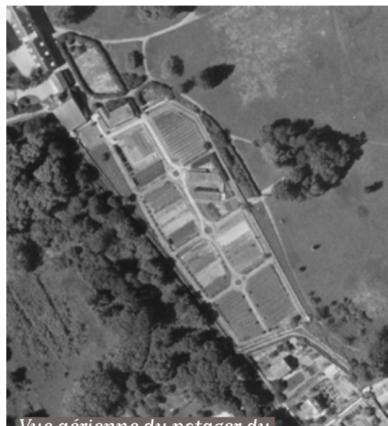
Vue aérienne du potager du parc du Grand Veneur en 1951.

Grand Veneur resteront accessibles au public durant les travaux. Les travaux de dépollution comprendront également des mesures strictes pour éviter la dispersion des poussières et garantir la sécurité des riverains.