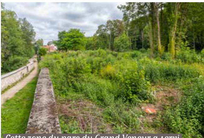
Cette zone du parc du Grand Veneur a servi de décharge dans les années 80 et 90.

A près d'importants travaux de dépollution, le parc du Grand Veneur accueillera un jardin potager à la française. Ce projet, inscrit dans l'engagement environnemental de la commune, vise à devenir un lieu de rencontre, de partage et d'activités de jardinage pour les Soiséens, sensibilisant aux enjeux écologiques.