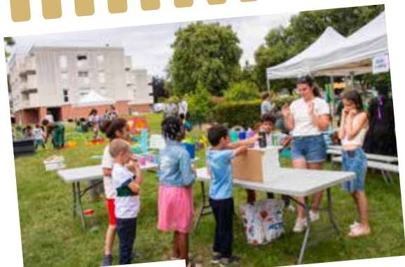
FÊTE DE GERVILLE

29 juin : la Fête de Gerville au cœur de la résidence : animations pour tous avec le Comité des fêtes, le Secours Catholique, Lire et faire lire, le Conservatoire, la médiathèque, les animateurs périscolaires et le Relais Petite Enfance.