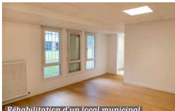
Réhabilitation d'un local municipal au domaine de Gerville.