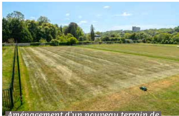
Aménagement d'un nouveau terrain de foot pour les enfants au stade des Donjons.