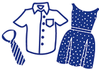
vêtements propres et secs