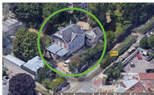
1 boulevard de la République.

Le bâtiment est destiné à accueillir des activités économiques conformes à un cahier des charges disponible à la Mairie.