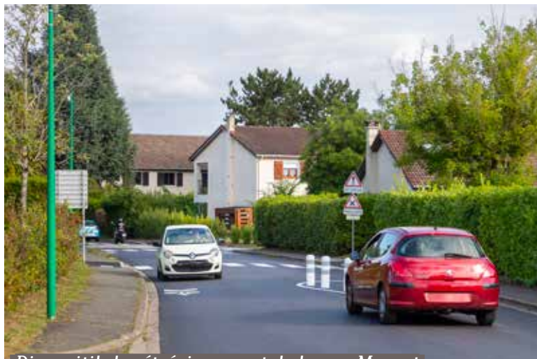
Dispositif de rétrécissement de la rue Mozart

En avril, un article annonçait le réaménagement des chicanes de la rue Mozart. Les travaux ont été réalisés et un aménagement provisoire est en place jusqu'à fin octobre.