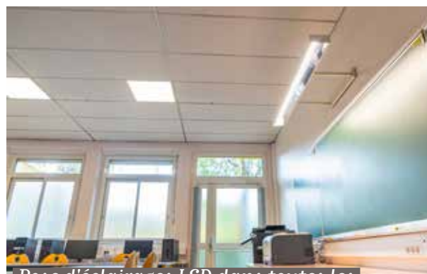
Pose d'éclairages LED dans toutes les classes de l'école élémentaire des Donjons.