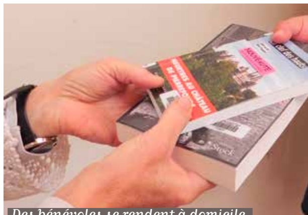
Des bénévoles se rendent à domicile.

À partir de septembre, la médiathèque met en place un service de portage à domicile gratuit destiné aux personnes isolées et à mobilité réduite habitant dans la commune. Ce service garantit l'accès à la culture et à la lecture pour tous les Soiséens ayant des difficultés à se déplacer.