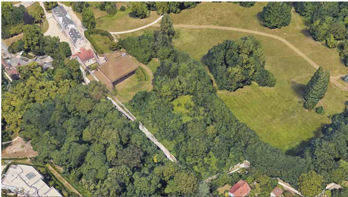
Le futur potager se situera dans la partie sud du parc du Grand Veneur, le long du chemin des Voûtes.

A près d'importants travaux de dépollution, le parc du Grand Veneur accueillera un jardin potager à la française. Ce projet, inscrit dans l'engagement environnemental de la commune, vise à devenir un lieu de rencontre, de partage et d'activités de jardinage pour les Soiséens, sensibilisant aux enjeux écologiques.