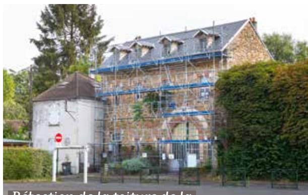
Réfection de la toiture de la Maison des Anciens Combattants.