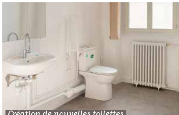
Création de nouvelles toilettes à l'espace associatif.