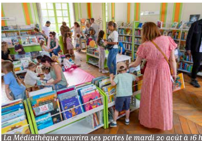
La Médiathèque rouvrira ses portes le mardi 20 août à 16 h