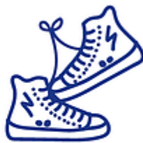
chaussures liées par paires