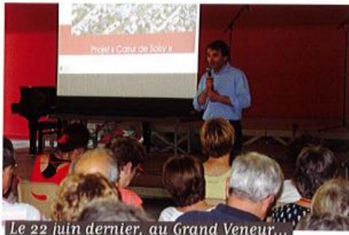
Le 22 juin dernier, au Grand Veneur...