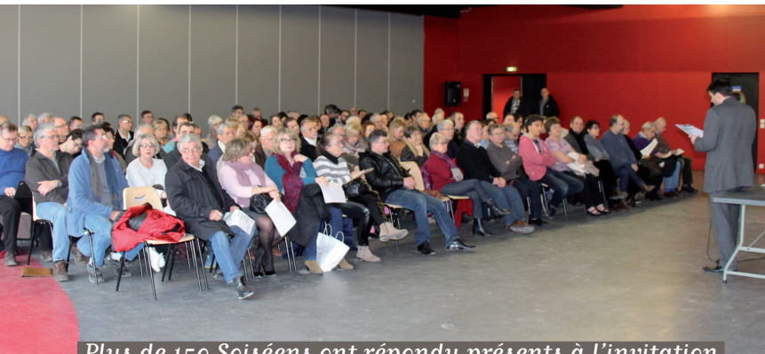
Plus de 150 Soisiens ont répondu présents à l'invitation de Jean-Baptiste Rousseau, Maire de Soisy-sur-Seine

Le 28 janvier dernier, le Maire de Soisy-sur-Seine a invité les usagers soisiens du RER D à une rencontre pour les informer du projet de modifications sur le RER D, proposé par la SNCF.