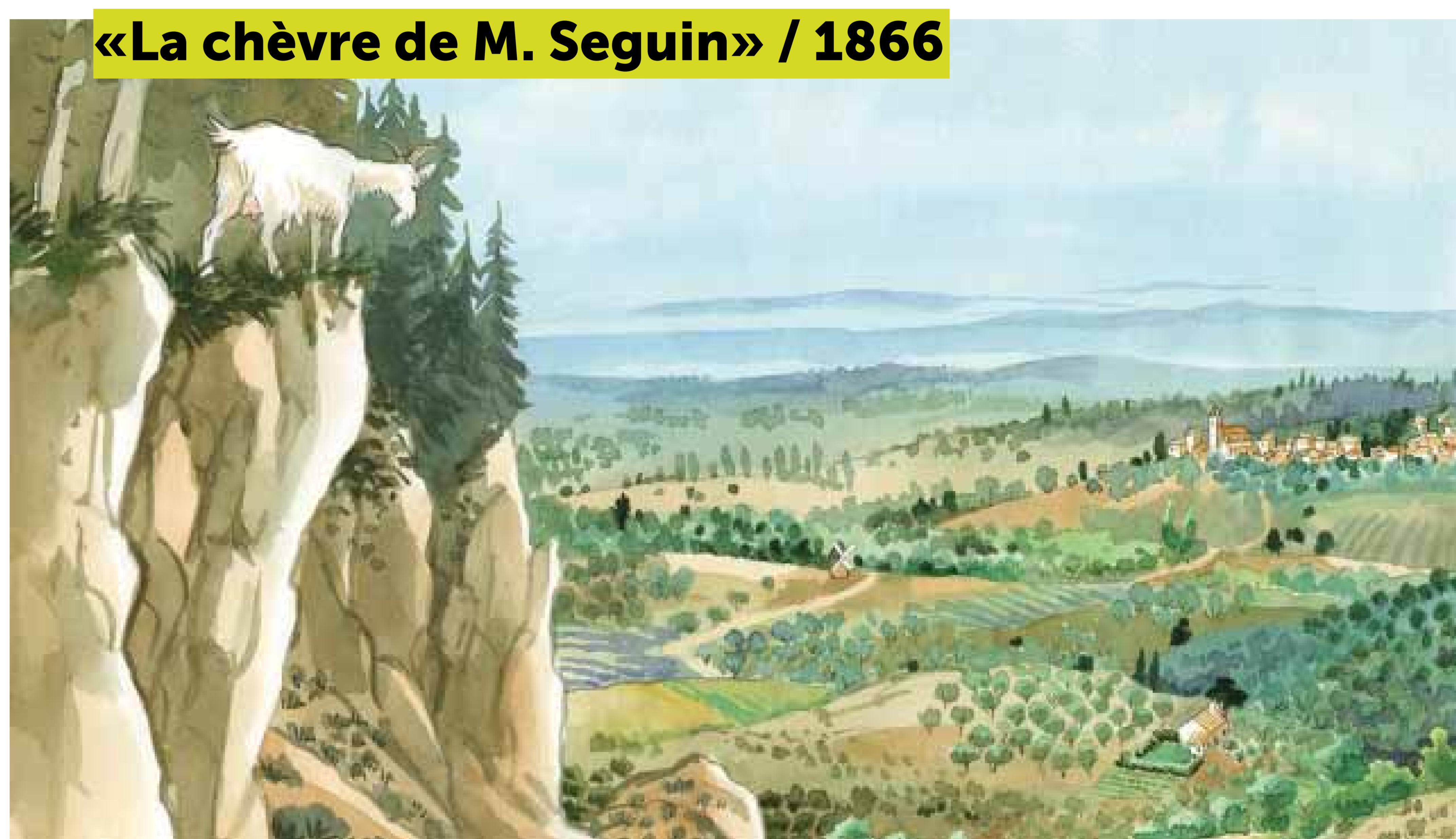
«La chèvre de M. Seguin» / 1866

«La Chèvre de monsieur Seguin» est l'une des nouvelles des «Lettres de mon moulin» d'Alphonse Daudet. D'après Claude Gagnière, elle est clairement attribuée à son prête-plume, Paul Arène.