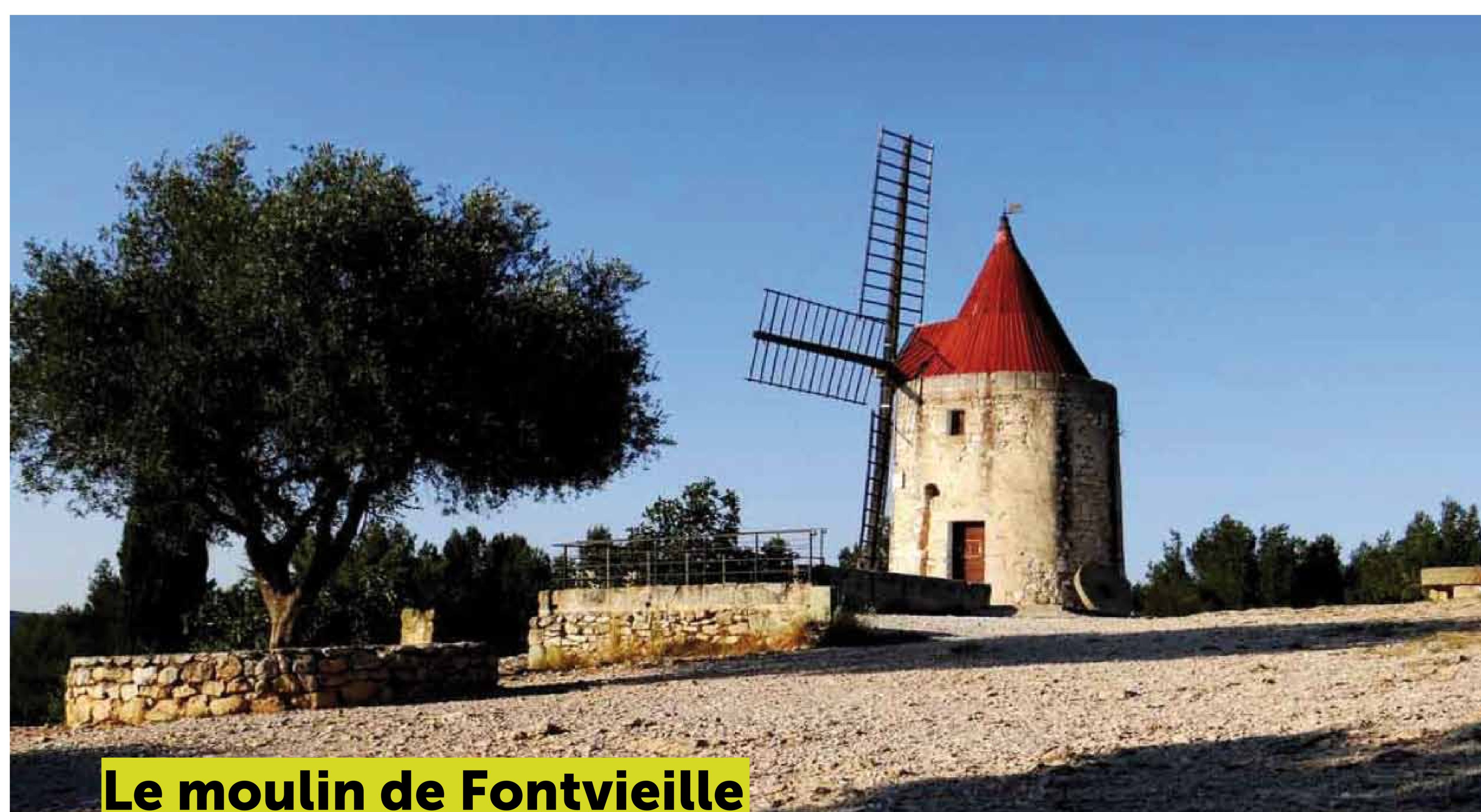
Le moulin de Fontvieille

Les «Lettres de mon moulin» est un recueil de nouvelles d'Alphonse Daudet. Le titre fait référence au moulin Saint-Pierre, situé à Fontvieille (Bouches-du-Rhône). Une première édition du recueil est publiée en 1869 («Impressions et Souvenirs»). Dix ans plus tard, une nouvelle édition est qualifiée de définitive. Elle inclut cinq autres nouvelles parues dans «Le Bien public» en 1873 (Les Étoiles, Les Douaniers, Les Oranges, Les Sauterelles, En Camargue) et un récit de Noël repris des «Contes du lundi» (Les Trois Messes basses).